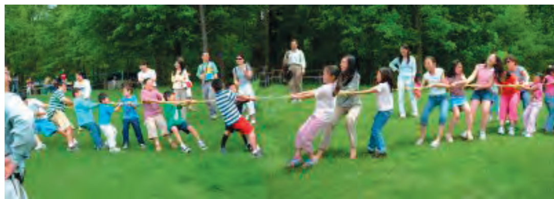
每个学年结束，全校师生及家人都要相聚在一起，举行野外聚餐。丰盛佳肴，精彩的活动谁都不愿错过。今年的聚餐于6月1日中午在Eagle Creek Park, Shelter B举行。恰逢十五周年校庆，活动规模将比往年更多更丰富。