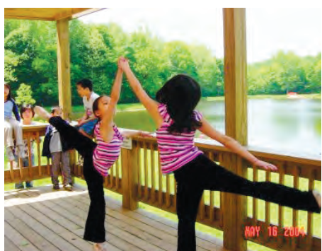
这两个在2004年5月聚会时翩翩起舞的小姑娘，现在已是两个大学毕业生了。