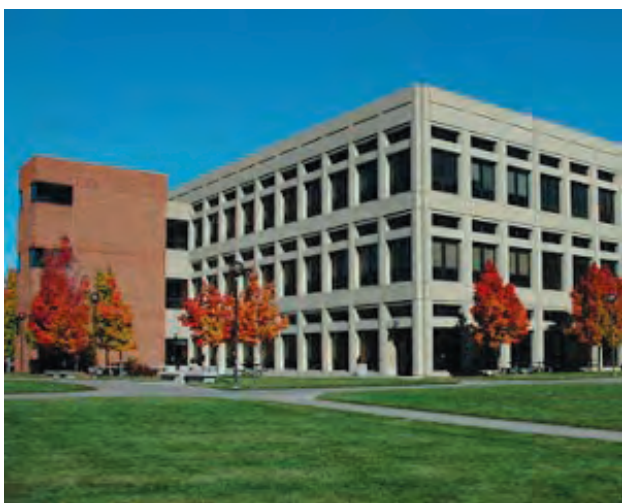
在IUPUI校园“安家”，中文学校不仅交通方便、环境安全优雅，教学设备也是一流的。